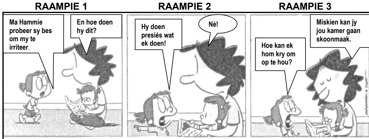
[Verwerk uit Die Burger , 8 Februarie 2018]