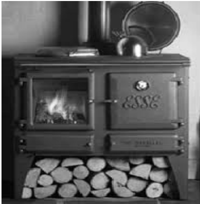
↑ Prentjie A

Lees die onderstaande teks en beantwoord vraag 1-17.