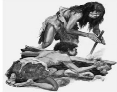
↑ Prentjie B